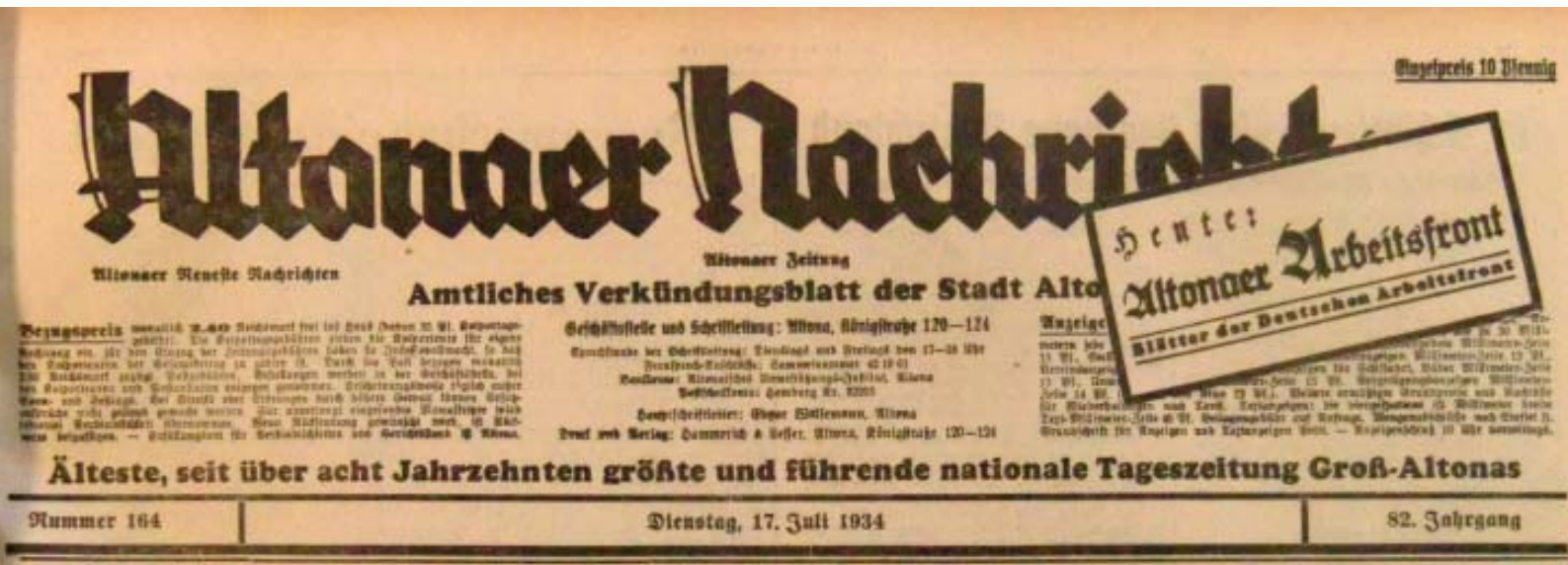
So sah die Titelzeile der Altonaer Nachrichten im Jahre 1934 aus und diente den Nazis - gewollt oder nicht - auch als wichtiges Medium zur Verbreitung ihrer Ideologien direkt vor Ort

Zur Arbeit der Ortsgruppe wird ein Fachreferentenkreis bestimmt, dem auf der einen Seite das Gebiet der Forschung, auf der anderen Seite die praktische Arbeit zugewiesen ist. Durch rege Presse- und Vortragstätigkeit sollen die Werte und Grundlagen unseres Volkstums zum Allgemeingut eines jeden Deutschen gemacht werden.