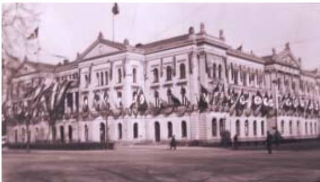
Das Altonaer Rathaus 1937 im Nazi-Fahnenschmuck

Der 1. April 1937 war ein Festtag für die Bevölkerung des ganzen Groß-Hamburger Gebiets. Straßen und öffentliche Gebäude waren mit Flaggen und Girlanden reich geschmückt.